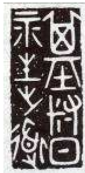
Σφραγίδα: ΧΡΙΣΤΟΣ ΤΟ ΑΙΩΝΙΟ ΤΑΟ